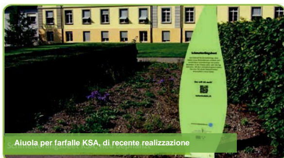
Aiuola per farfalle KSA, di recente realizzazione