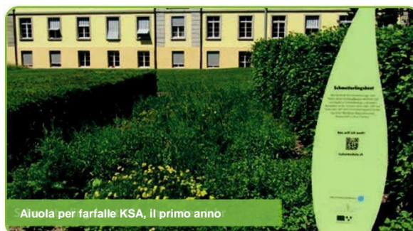
Aiuola per farfalle KSA, il primo anno