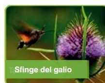
Sfinge del galio